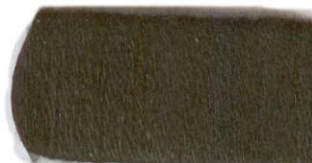
Темно- оливковый №82