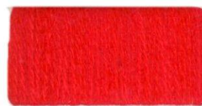
Красный мак №334