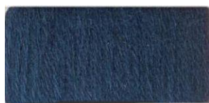
Морская волна №60