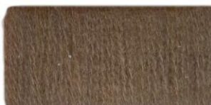
Дубовая кора №315