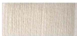
Речной песок №335