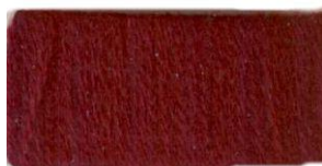
Свекольно- бордовый №92