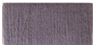
Пепельно- фиолетовый №364