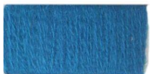
Темно- бирюзовый №155