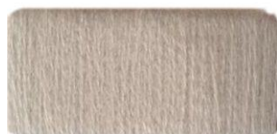
Бежево- льняной №295