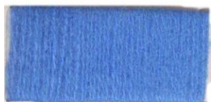
Синий дождь №395