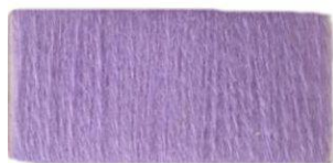
Ярко- сиреневый №348