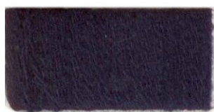
Матросский синий №178