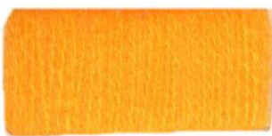
Желто- оранжевый №394